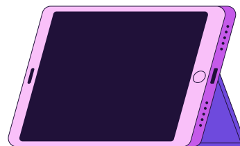
iPadi atorlugu suliaqarneq