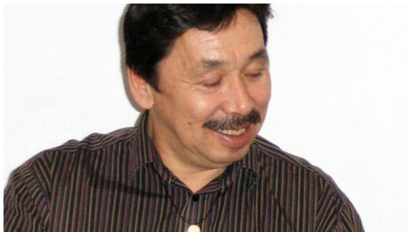
Nusukap sulinngitsoortarneq iliuseqarfigeqqaa.

Tigulaarinniffik: Kalaallit Nunaata Radioa Greenlandic Broadcasting Corporation Inuussutissarsiutit · septembarip 23-at 2014 · 05:10 allattoq Niels Krogh Søndergaard · Nutserisoq: Simon Uldum · Tags: Nusuka, sulinngitsoortarneq